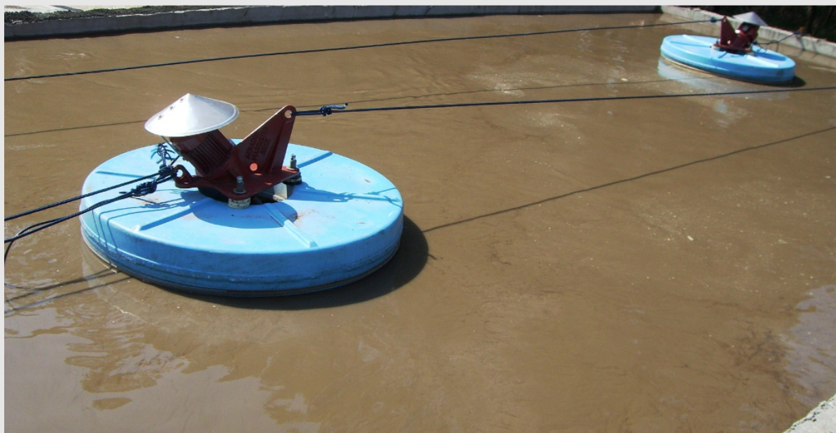
Tanque anaerobico com 2un de AGM100 5CV